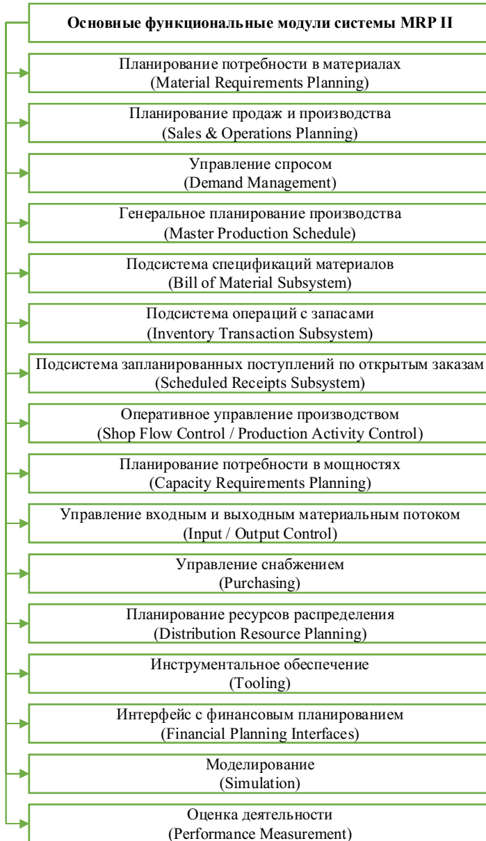
Рис. 1. Основные функциональные модули системы MRP II (составлено автором по материалам [2])